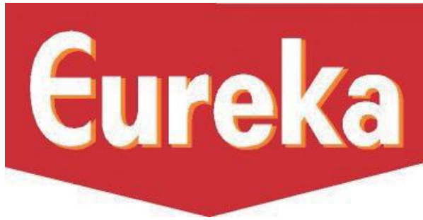
Nombre comercial de la franquicia